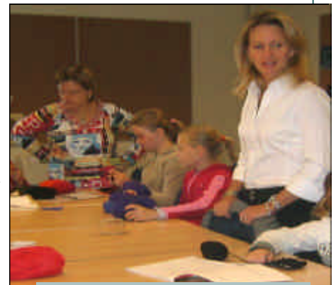
Þorgerður menntamálaráðherra í heimsókn í skólanum í september sl.

Virðing fyrir sjálfum sér og öðrum, ábyrgð, traust, kærleikur, jafnrétti, jákvæð samskipti, tillitssemi, hlýja og umhyggja, snyrtimennska, kurteisi, vinnusemi, samvinna, heiðarleiki og gleði.